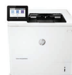
Imprimante LaserJet Managed E60165