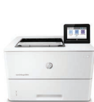
Imprimante LaserJet Managed E50145