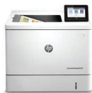
LaserJet Couleur E55040 gérée