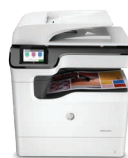
PageWide Color MFP 774