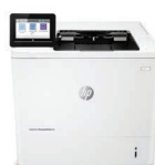
Imprimante LaserJet Managed E60155