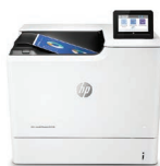
LaserJet Couleur Managed E65150