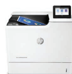
LaserJet couleur gérée E65160