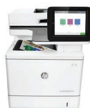
LaserJet Couleur Imprimante multifonction PageWide Managed E57540