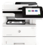
Imprimante multifonction LaserJet Managed E52645