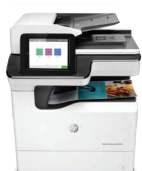
Multifonction PageWide Enterprise Color 780