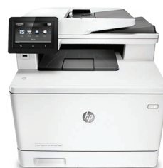
HP Color LaserJet Pro MFP M477fdw

Wi-Fi bibande pour une connexion sans fil plus fiable 7 et Bluetooth® basse consommation pour une configuration et une impression sans fil plus simples ; 8 HP Roam for Business 10