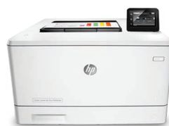
HP Color LaserJet Pro M452dw

Wi-Fi bibande pour une connexion sans fil plus fiable 7 et Bluetooth® basse consommation pour une configuration et une impression sans fil plus simples ; 8 HP Roam for Business 10