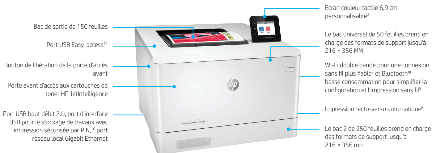
Illustration : imprimante HP Color LaserJet Pro M454dw