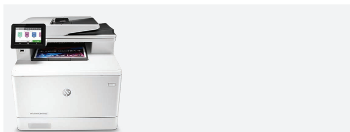
HP Color LaserJet Pro MFP M479fdw

Écran tactile personnalisable de 10,9 cm avec interface utilisateur intuitive à icônes 3