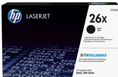
Cartouches de toner HP avec JetIntelligence

Tirez le meilleur parti de votre multifonction. Imprimez régulièrement un plus grand nombre de pages de haute qualité 2 avec la conception spéciale des cartouches de toner HP avec JetIntelligence. Profitez d'une meilleure performance et d'une plus grande efficacité énergétique et surtout de la qualité HP authentique que vous attendez et avec laquelle la concurrence ne peut tout simplement pas rivaliser 2 .